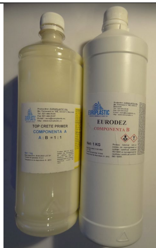
a) TOP CRETE Primer Amestec: A:B=1:1 Foto: (A 1kg) +(B 1kg)