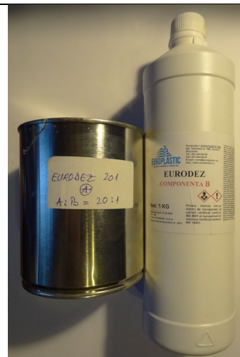
c) ADEZIV EURODEZ AP 201, Amestec: A:B=20:1 Foto: (A 1kg) +(B 1kg)