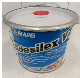
d) ADEZIV ADESILEX VZ Foto: 10 kg