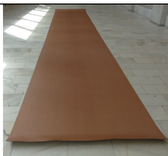
e) Membrană hidroizolantă IZO-35 cu țesătură din poliester EE80 grosimi: 2,0mm, 2,5mm și 3,0mm