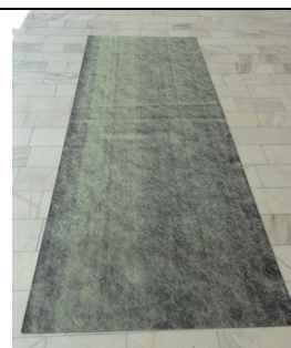
f) Membrană hidroizolantă IZO-35, cu țesătură din poliester PE-IC-50 grosimi: 2,0mm, 2,5mm și 3,0mm