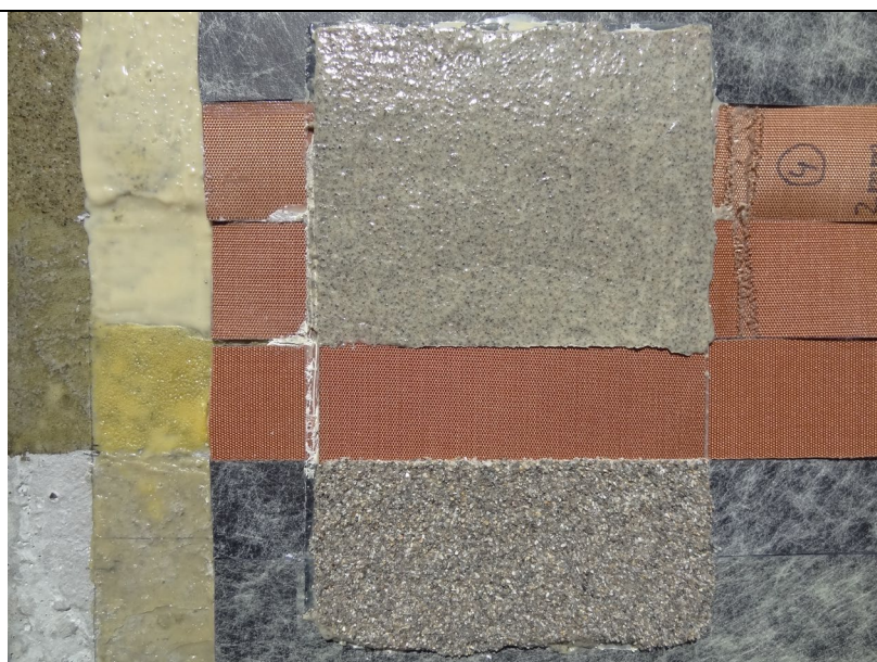
g) Exemplu de aplicare ale materialelor componente ale sistemului hidroizolant IZO-35 - pe prima coloană din stânga: • jos: strat suport din beton • mijloc: TOP CRETE Primer • sus: TOP CRETE Primer+nisip -pe a doua coloană din stânga: • jos: Adeziv EURODEZ AP201 • mijloc: Adeziv ADESILEX VZ • sus: Adeziv EURODEZ AP61 -pe a treia coloană din stânga: • membrane hidroizolante IZO-35 -pe a patra coloană din stânga: • strat de protecție pe membrană alcătuit din EURODEZ AP61, cu nisip adăugat-sus nisip presărat-jos